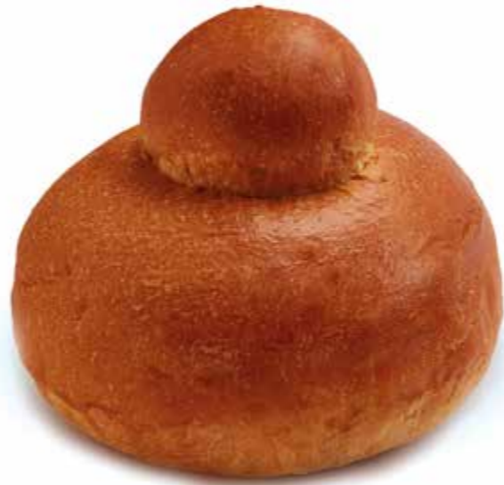
COD: 40BRI BRIOCHES SICILIANA già cotta