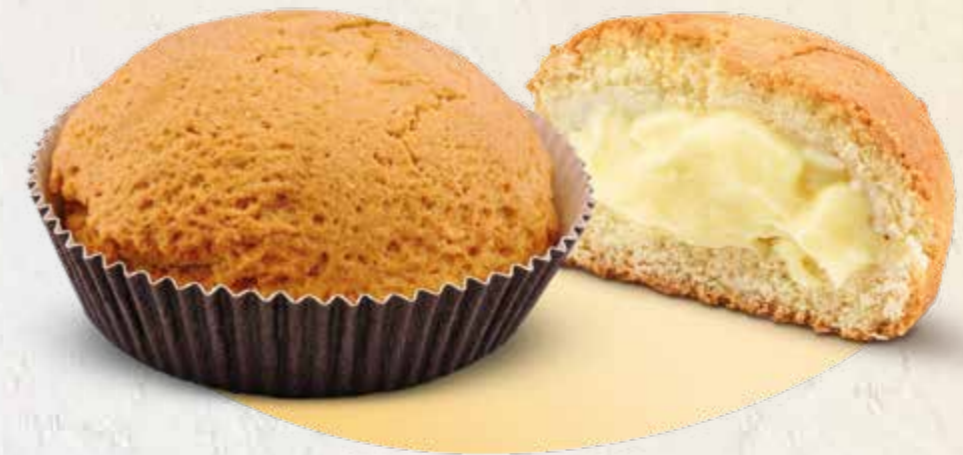
COD: PANCRE PANZEROTTO CREMA MAXI già cotti