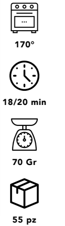
COD: MINICIO MINI PANZEROTTO CREMA NOCCIOLE E CACAO