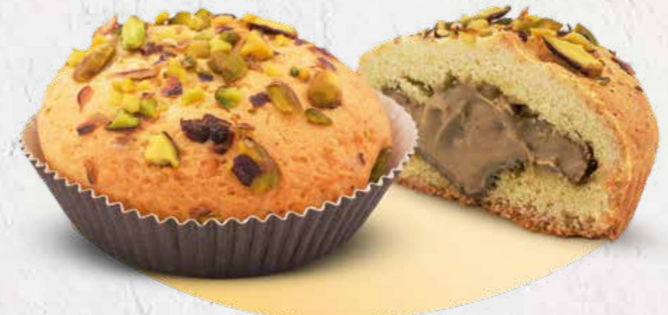
COD: PCPMo1 PANZEROTTO ALLA CREMA DI PISTACCHIO MAXI già cotti