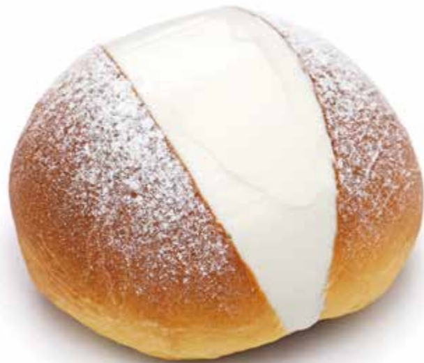
COD: MRTZo1 MARITONNO Panna e Crema già cotto